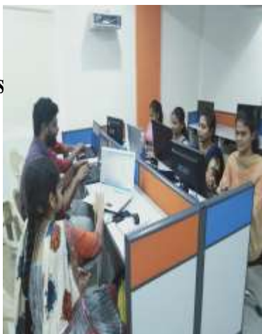
Students at Idea labs Hitech city Hyderabad

A Internship at “IDEA LAB” 1 st May 2019 to 15 th June 2019